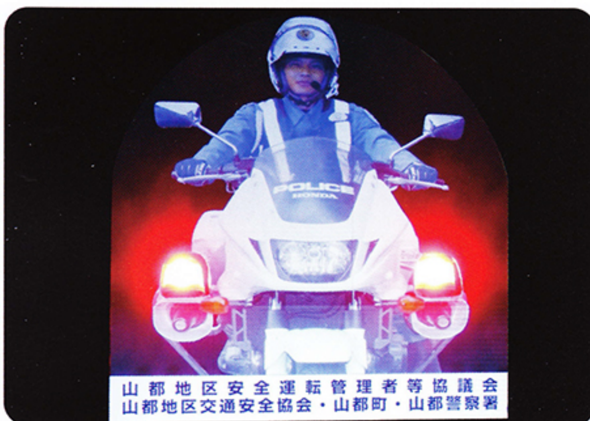
山都地区安全運転管理者等協議会 山都地区交通安全協会・山都町・山都警察署