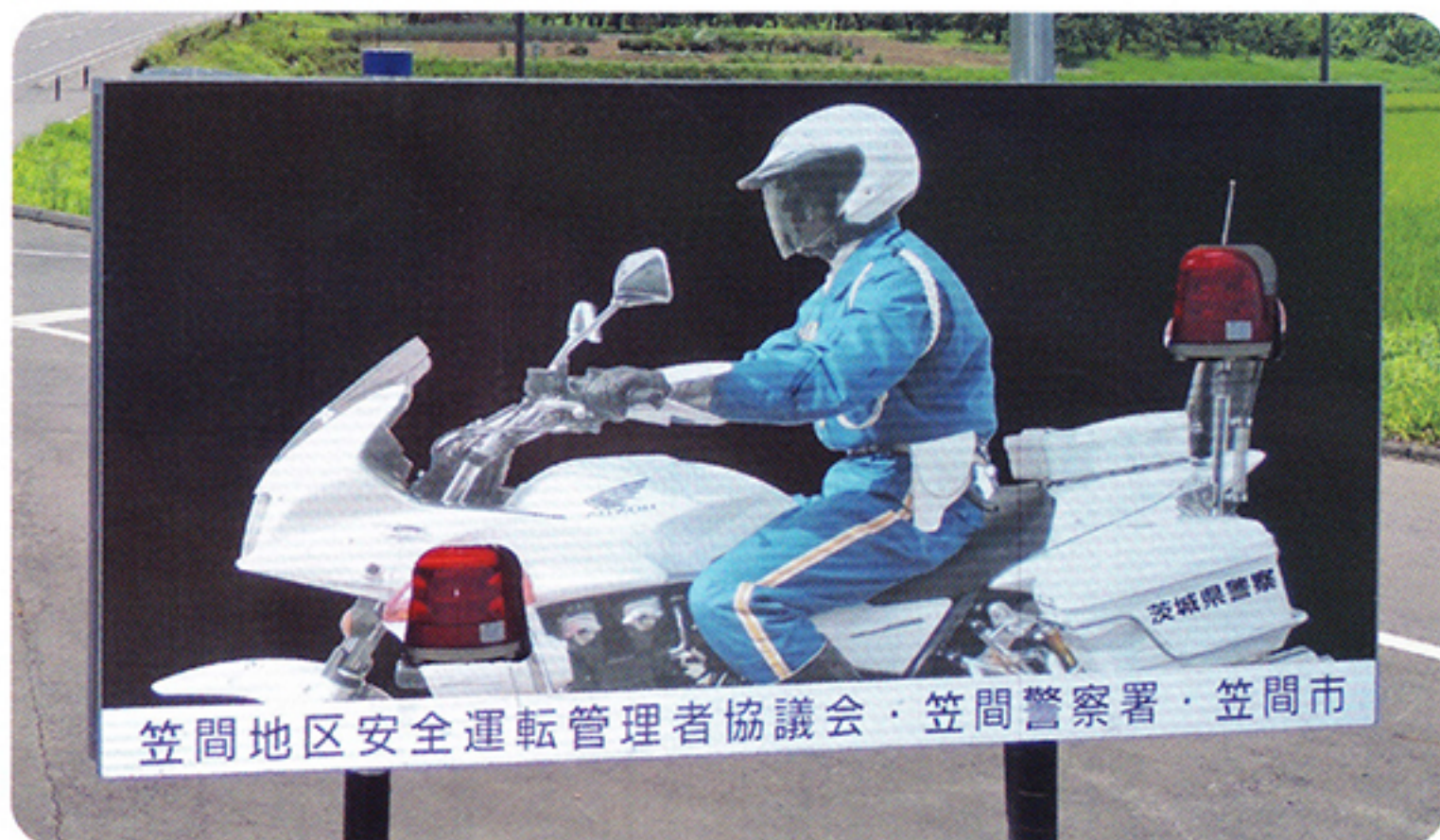
笠間地区安全運転管理者協議会・笠間警察署・笠間市

白バイ隊員が交通警戒中の姿でソーラー赤色灯2ヶが昼夜点灯・消灯を繰り返 し年中無休で注意喚起する看板