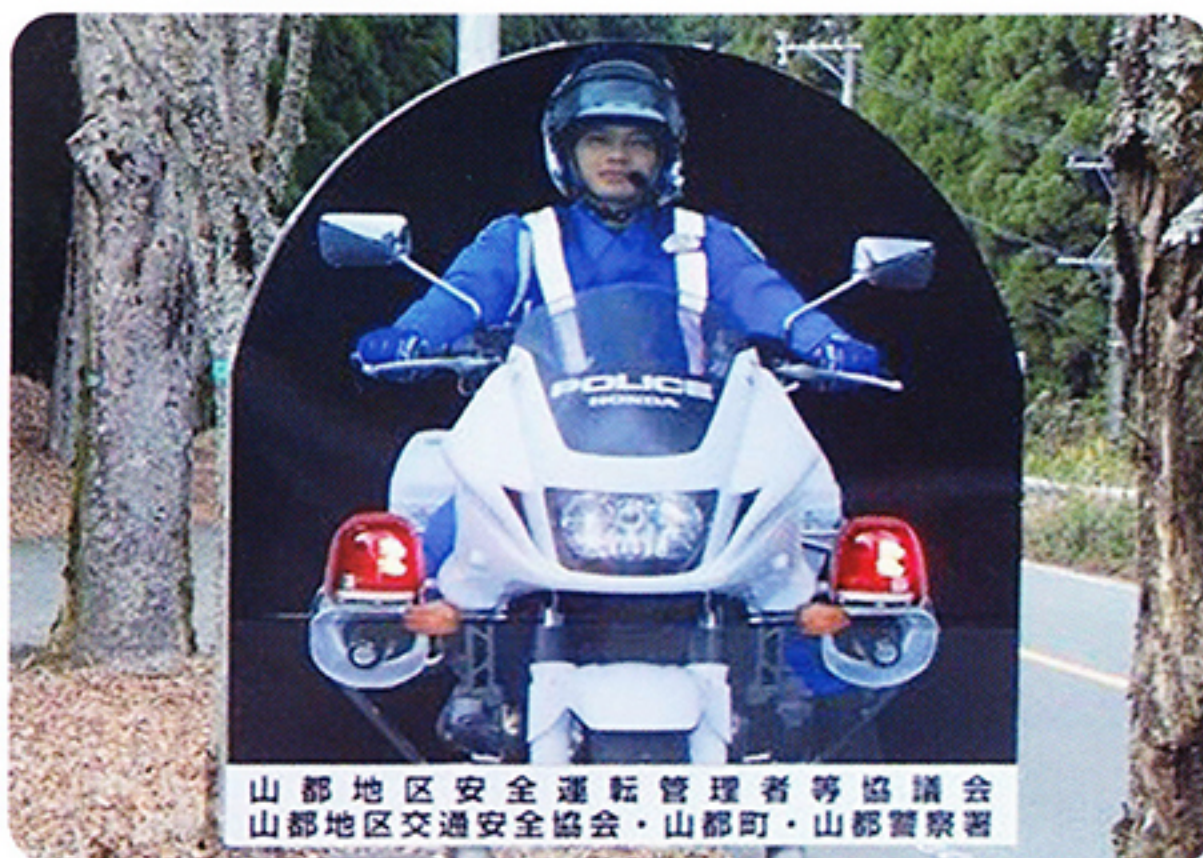
山都地区安全運転管理者等協議会 山都地区交通安全協会・山都町・山都警察署