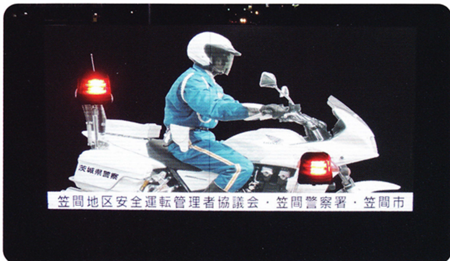
笠間地区安全運転管理者協議会・笠間警察署・笠間市